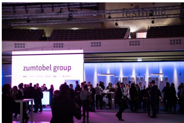
Bild 3: Nahezu 6.000 Kunden besuchten die Zumtobel Group auf der Light + Building 2018 und informierten sich über konkrete Anwendungsbeispiele und maßgeschneiderte Lichtlösungen.