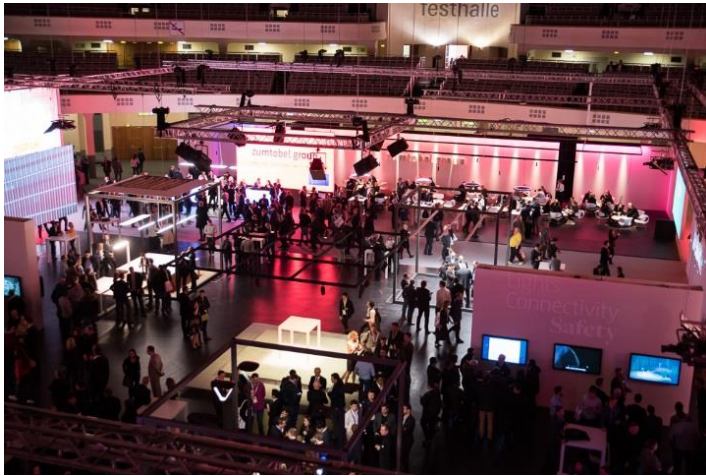
Bild 1: Der offen gestaltete Messestand der Zumtobel Group legte mit der Präsentation von Services und vernetzter Beleuchtung den Fokus auf die jüngste Marke der Gruppe Zumtobel Group Services.