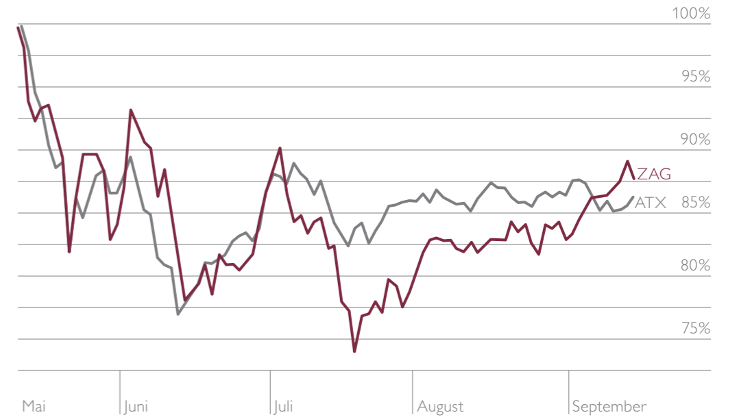
Zumtobel Kurs gegen ATX, 11. Mai 2006 bis heute

ISIN: AT0000837307 Börsenkürzel: ZAG Reuters Symbol: ZUMV.VI Bloomberg Symbol: ZAG AV Anzahl der Aktien: 44.704.344 Streubesitz: 60,4%